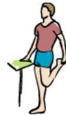
cuádriceps (de pie)