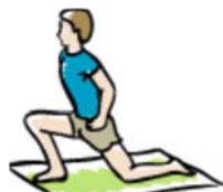
estocada hacia adelante