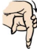
flexión de la muñeca