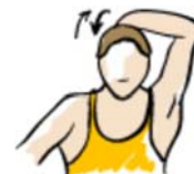
cuello (frente y atrás)