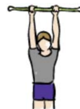
flexión del hombro