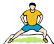
estocada hacia el lado