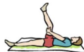
estirar del tendón de la corva (con pierna hacia arriba)