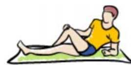
estiramiento de la cadera desde la posición sentado