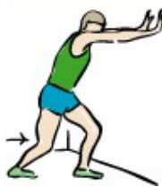
estiramiento de la pantorrilla (soleo)