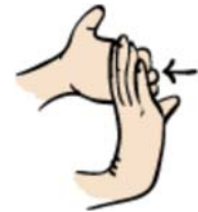
extensión de la muñeca