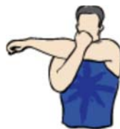
posterior del hombro