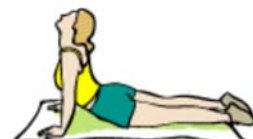
extensión hacia atrás