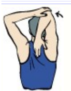
hombro arriba de la cabeza