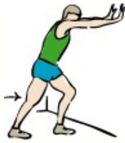
estiramiento de la pantorrilla